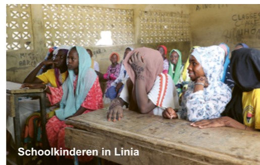
Schoolkinderen in Linia

"Dat meer mensen weten hoe belangrijk onderwijs is, zie ik terug in de klas"